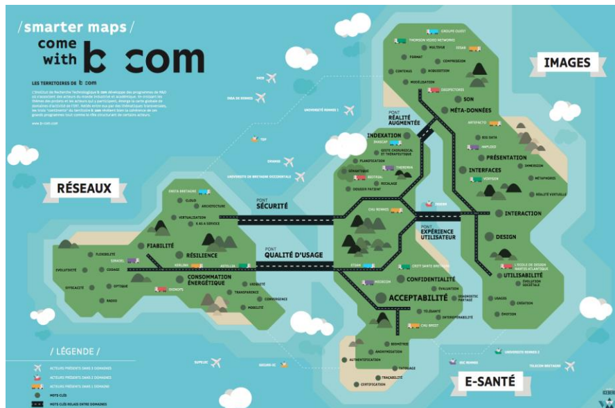
Les territoires technologiques de b<>com

Parfait symbole de leur maillage, la cartographie du réseau des IRT offre à elle seule une synthèse de la journée, tournée vers la force de frappe et les liens déjà actifs entre ces structures nouvelles dans le paysage mondial de l'innovation.